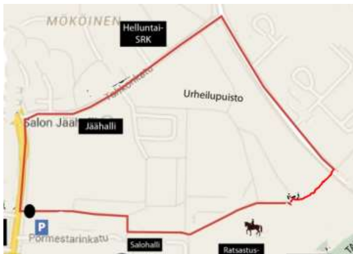
Kuva 2 Andin lyhyt lenkki