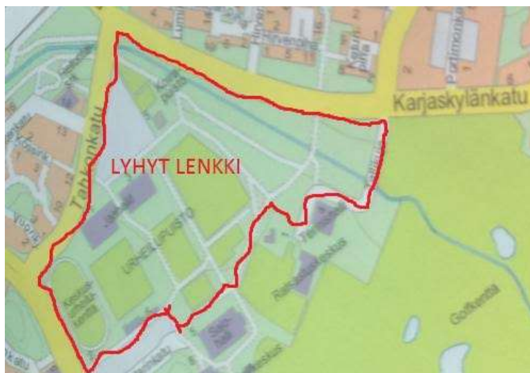
Kuva 4 Reittikartta, Andi-maratonin lyhyt kierros