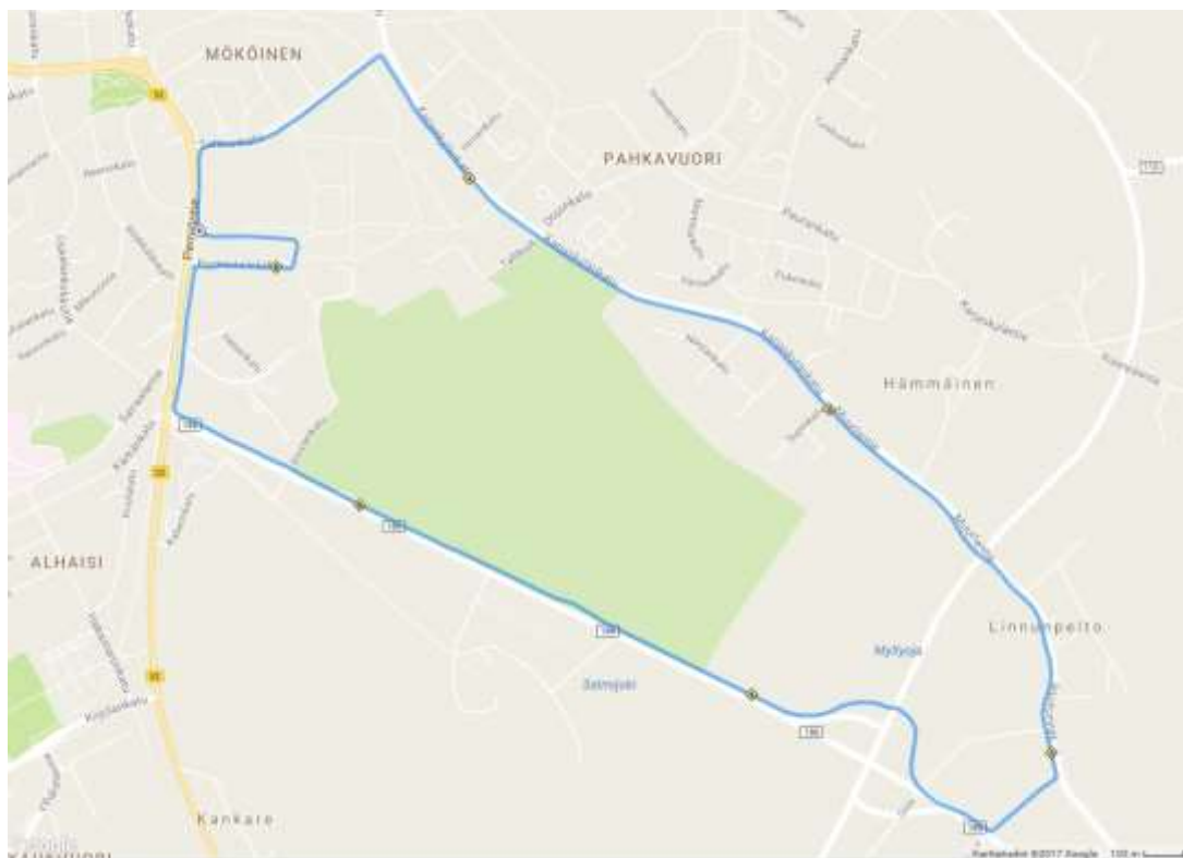
Kuva 3 Reittikartta, Andi-maratonin pitkä kierros

Samassa yhteydessä mittasin Andi-maratonin uuden reitin, sillä tietöiden valmistuttua pitkä kierros oli nyt valmis virallisesti mitattavaksi.